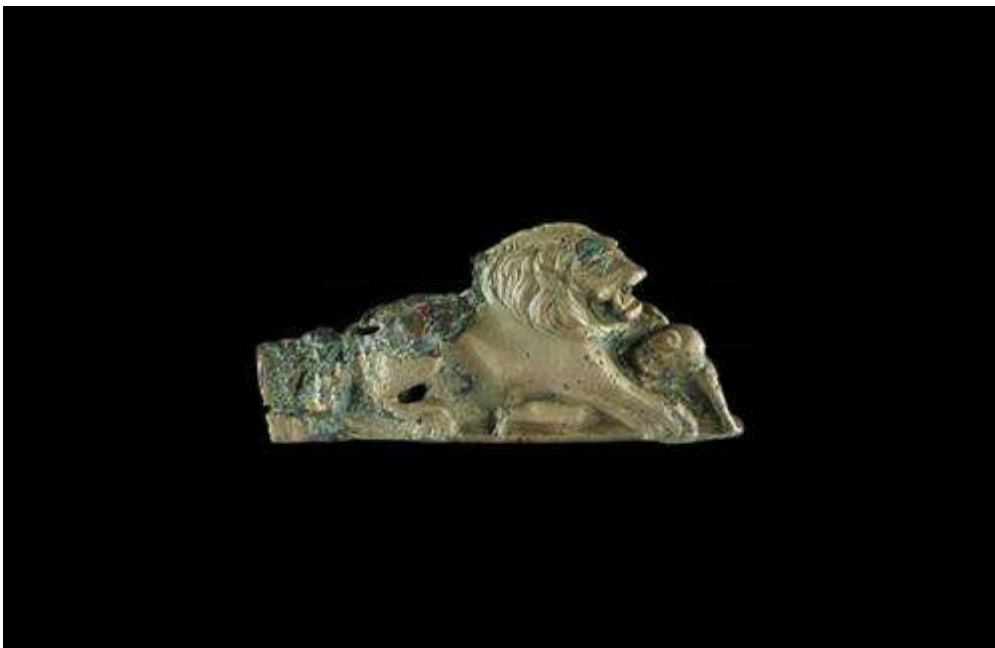
Abb. 06: Bronzener Schlüsselgriff aus Brampton

Ein dem Berzdorfer Fund relativ ähnliches Stück zumal es gleichfalls aus einem Brunnen geborgen wurde, stammt aus Brampton (GB). Es handelt sich auch hier nur um den bronzenen Griff, der potentiell eiserne „Bartteil“ ist abgebrochen ( Abb. 6 ).