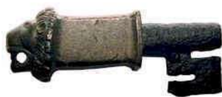
Abb. 04: römischer Schlüssel aus Weston Underwood (Original im Bucks County Museum)

Ein römischer Schlüssel mit bronzenem Löwenkopf und eisernem Stil und Schlüsselbart wurde 1993 in Weston Underwood bei Kanalbauarbeiten gefunden ( Abb. 04 ). Er datiert wahrscheinlich in das 2. Jh.. Trotz des einfacheren Designs wird für dieses Exemplar eine Funktion als Schlüssel für eine sehr bedeutende Tür oder Truhe angenommen und sein Wert innerhalb der Römerzeit als hoch eingeschätzt.