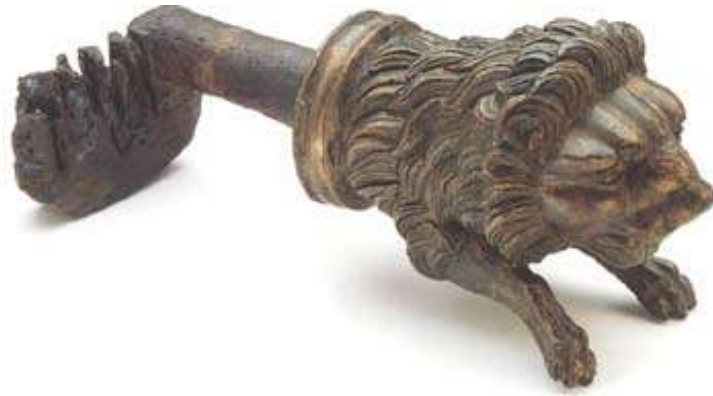
Abb. 05: Augster „Tempelschlüssel“ ( Inventarnummer: 1939.807 ); ca. 100 – 150 n.Chr.

Ein dem Berzdorfer Fund relativ ähnliches Stück zumal es gleichfalls aus einem Brunnen geborgen wurde, stammt aus Brampton (GB). Es handelt sich auch hier nur um den bronzenen Griff, der potentiell eiserne „Bartteil“ ist abgebrochen ( Abb. 6 ).