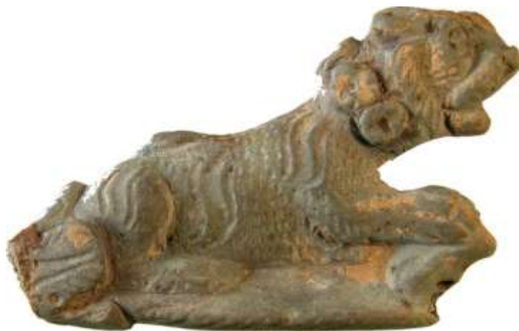
Abb. 01 Fragment eines Schlüssels mit Löwendarstellung

Der als Schlüsselgriff interpretierte Bronzelöwe ( Abb. 01 ) wurde hier während der Ausgrabungen im Jahr 2002 aus einem römischen Brunnenbefund geborgen.